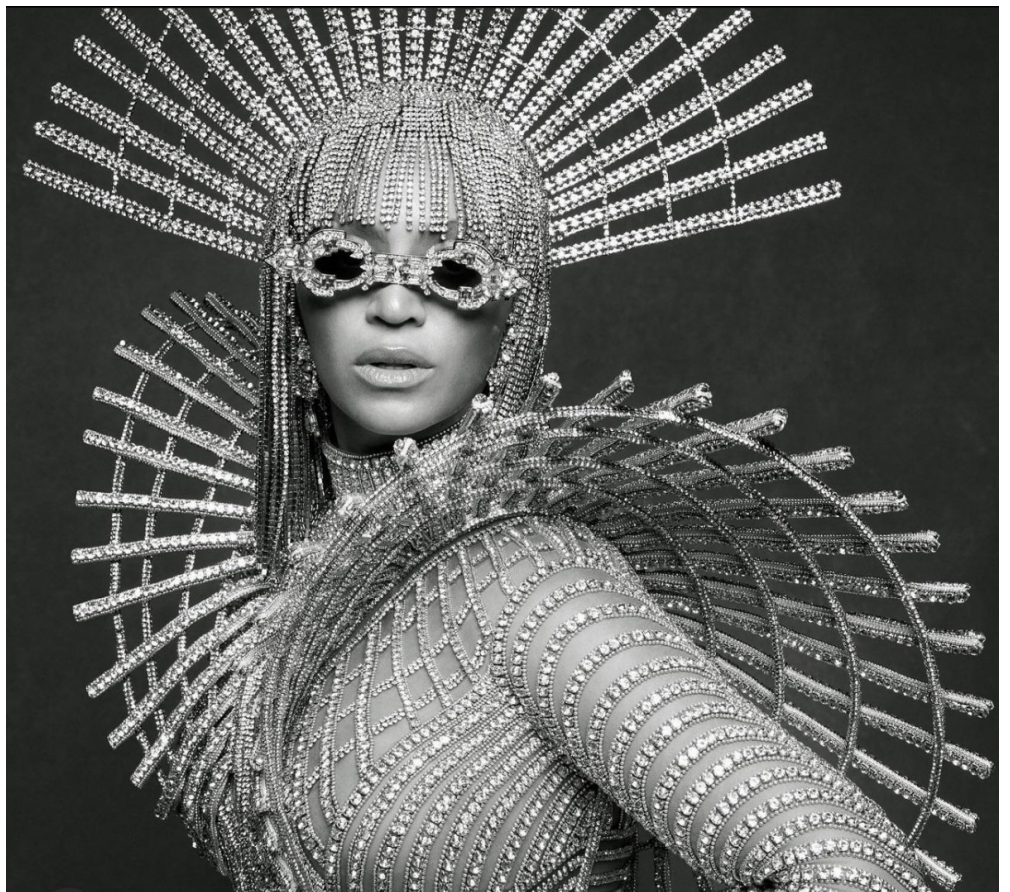
Création de la perruque en strass / Vogue avril 2023