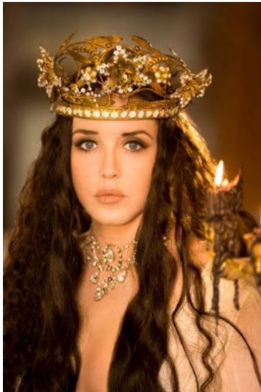
Création des perruques pour Isabelle Adjani.