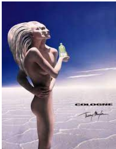
Création et fabrication des perruques