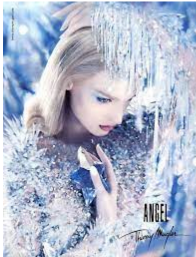
Création et fabrication de la perruque