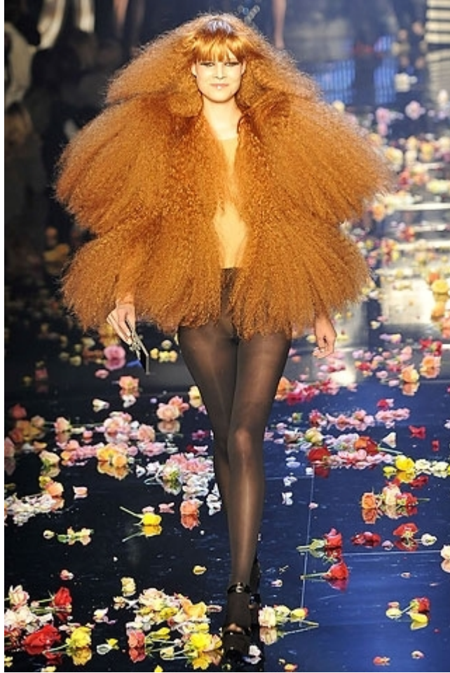
Création de la coiffure de Sonia Rykiel déclinée en 20 perruques en fibre synthétique