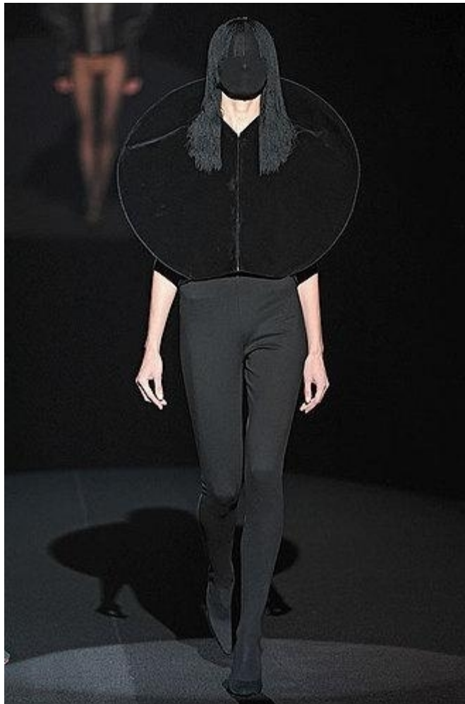
Création de perruques en fils de viscose