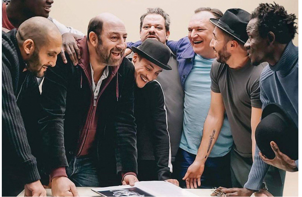
Création des coiffures / Chef coiffeuse du tournage (2019)