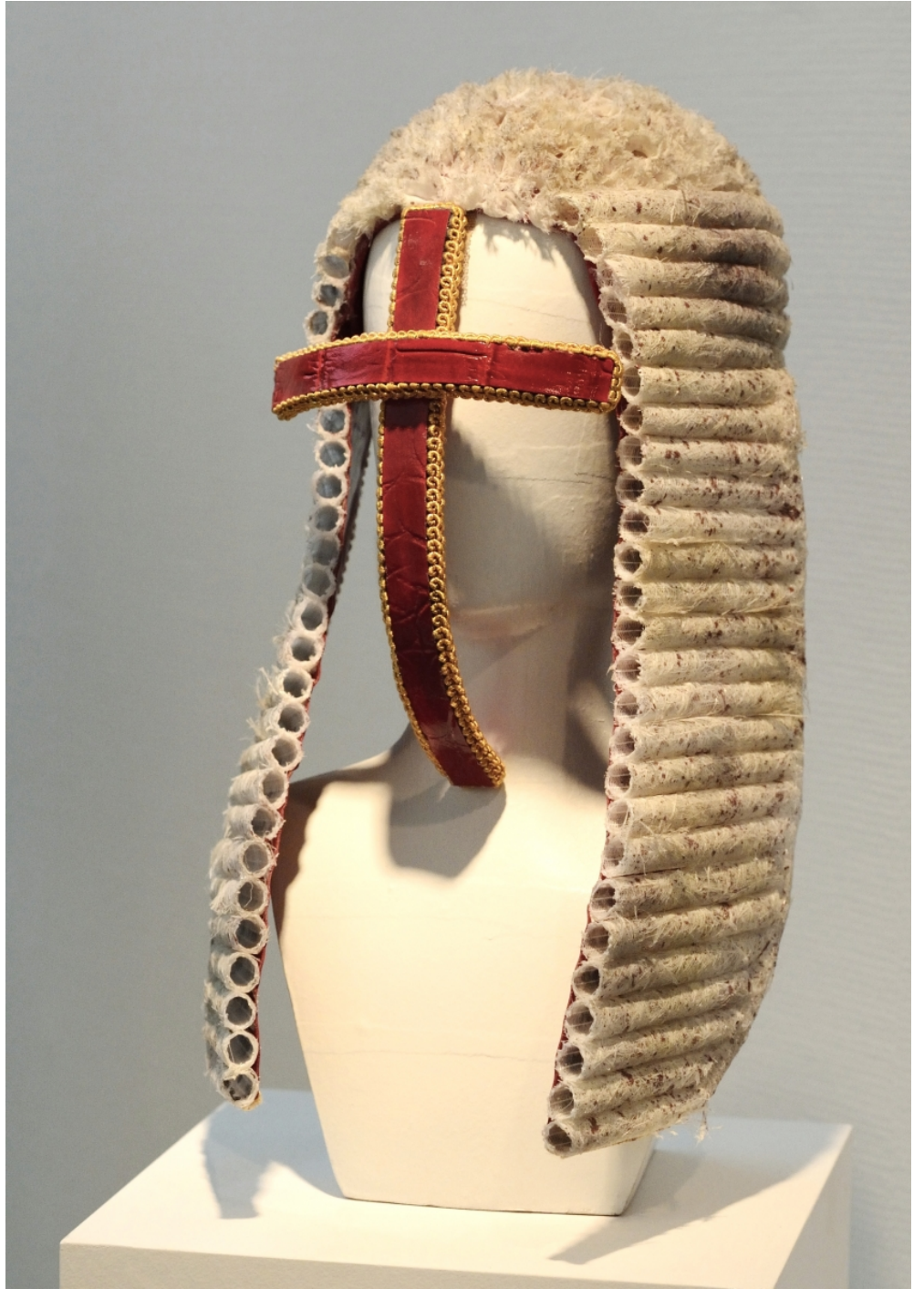
Création et fabrication des perruques