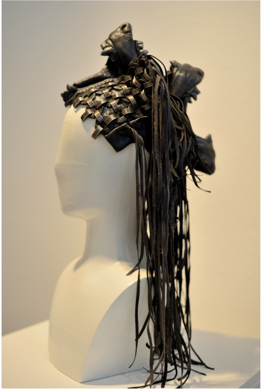
Création et fabrication des perruques