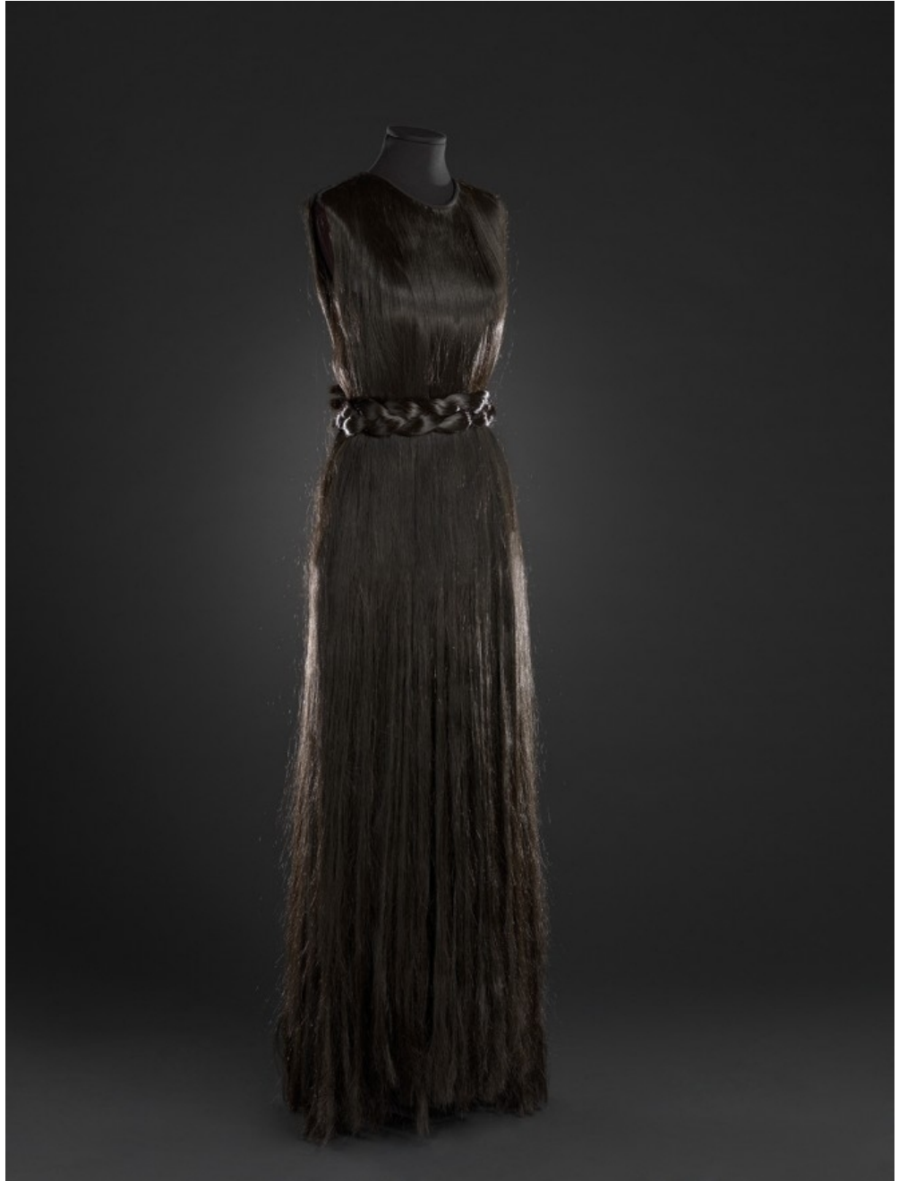
Fabrication de la robe, présente dans le fonds du MoMu (Anvers)