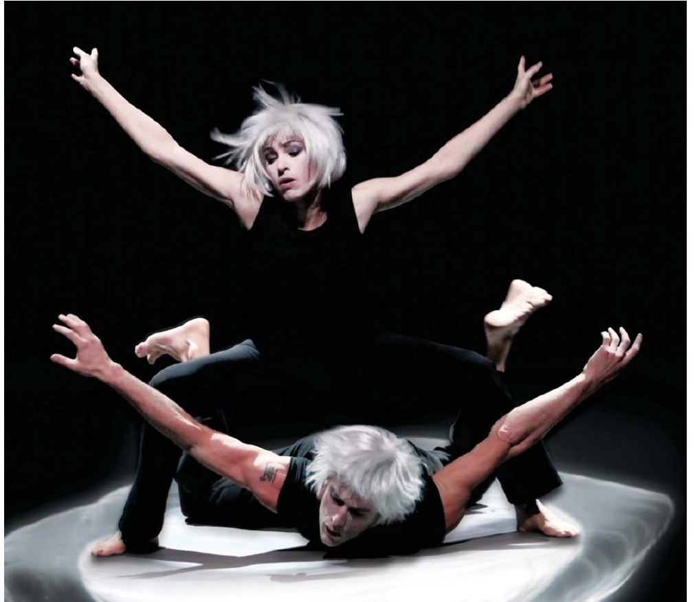
Création des perruques